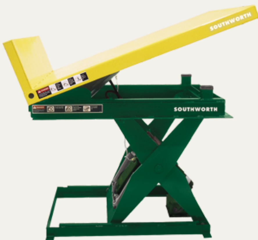
MESA ELEVADORA HIDRÁULICA BAHSAVER CONFORT EDGE